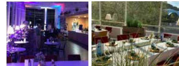
Oben: Foyer der Konzerthalle, unten: Gartensaal